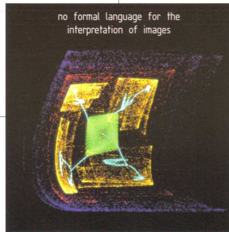
no formal language for the interpretation of images